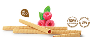
BRINS FRAMBOISE 7 étuis de 7 - 825 g DDM* : 3 mois