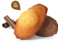
MADELEINES CHOCOLAIT 50 emballages individuels - 1080 g DDM* : 2 mois