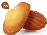
MADELEINES NATURE 50 emballages individuels - 850 g DDM* : 2 mois