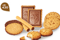
MÉLI-MÉLO DE BISCUITS 46 étuis de 2 - 900 g 8 étuis de 2 Biscuits ChochoNoisettes - 14 étuis de 2 Craquants Cacao 14 étuis de 2 ChochoNoisettes - 10 étuis de 2 Tablettes Caramel d'Érable 8 étuis de 2 Petit-Biscuits Chochoir DDM* : 5 mois