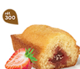
BIJOU FRAÏSE 20 emballages individuels - 660 g DDM* : 2 mois