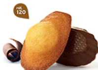
MADELEINES CHOCHOIR 50 emballages individuels - 1050 g DDM* : 2 mois