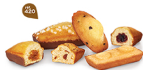
BOUQUET DE PÂTISSERIES 30 emballages individuels - 850 g 5 Madeleines Pêpites - 5 Odeurs Chochoir - 5 Bijou Caramel Chochoir 5 Bijou Myrtille - 5 Financiers Amandes - 5 Cakes Fruits DDM* : 2 mois