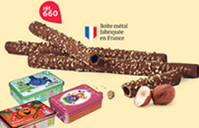
COFFRET BRINS PRALI'CHOC 5 étuis de 4 - 385 g DDM* : 2 mois