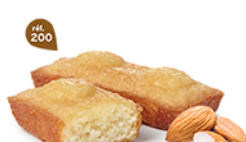
FINANCIERS AMANDES 30 emballages individuels - 600 g DDM* : 2 mois