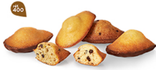
FARANDOLE DE MADELEINES 30 emballages individuels - 575 g 5 Madeleines Chochoir - 5 Madeleines Pêpites - 5 Madeleines Citron - 5 Madeleines ChochoPutache - 5 Madeleines Pécan & Sirop d'Érable - 5 Madeleines Caramel Chochoir DDM* : 2 mois