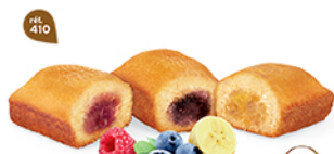
PANACHÉ DE BIJOU FRUITS 30 emballages individuels - 990 g 10 Framboises - 10 Myrtille - 10 Banane DDM* : 2 mois