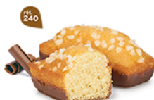
GÉNOIS CHOCOLAIT 30 emballages individuels - 510 g DDM* : 2 mois