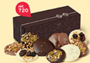
TUILES ET PALETS GOURMANDS 30 chocolats - 300 g DDM* : 10 mois