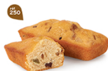
CAKES FRUITS 20 emballages individuels - 600 g DDM* : 2 mois