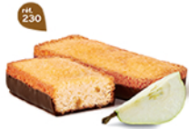
LINGOTS POIRE CHOCHOIR 25 emballages individuels - 675 g DDM* : 2 mois