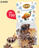
PETITS FLOCONS 10 flocons - 120 g DDM* : 2 mois