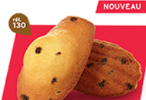
MADELEINES PÉPITES 50 emballages individuels - 900 g DDM* : 2 mois