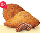
MADELEINES PÉCAN & SIROP D'ÉRABLE 30 emballages individuels - 350 g DDM* : 2 mois