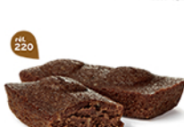
MOELLEUX CHOCOLAIT 30 emballages individuels - 600 g DDM* : 3 mois