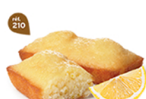
FONDANTS CITRON 30 emballages individuels - 660 g DDM* : 2 mois