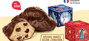
COFFRET MADELEINES ÉCRIN 18 emballages individuels - 430 g DDM* : 2 mois