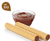
ROLINETTES CHOCHOISSETTES 45 étuis de 2 - 575 g DDM* : 2 mois