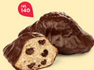
MADELEINES ÉCRIN 30 emballages individuels - 490 g DDM* : 2 mois