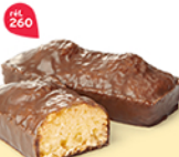
SHOWCOCO 25 emballages individuels - 730 g DDM* : 2 mois