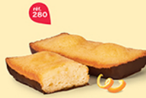
LINGOTS ORANGE CHOCHOIR 25 emballages individuels - 645 g DDM* : 2 mois