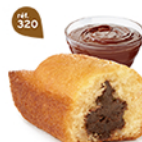
BIJOU CACAO 20 emballages individuels - 600 g DDM* : 2 mois