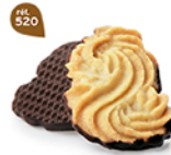
SABLÉS VIENNOIS 32 étuis de 2 - 620 g DDM* : 2 mois