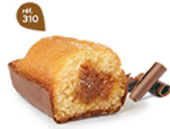
BIJOU CARAMEL CHOCOLAIT 20 emballages individuels - 720 g DDM* : 2 mois