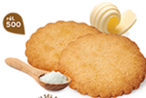
GALETTES 48 étuis de 2 - 880 g DDM* : 5 mois