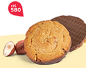
CRAQUANTS NOISETTE CHOCOLAIT 24 étuis de 2 - 360 g DDM* : 5 mois