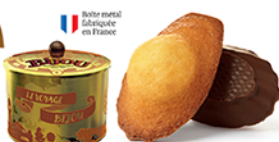
BOÎTE COLLECTOR MADELEINES CHOCHOIR 12 emballages individuels - 2100 g DDM* : 2 mois

La sélection saisonnière de Casse-Noisette